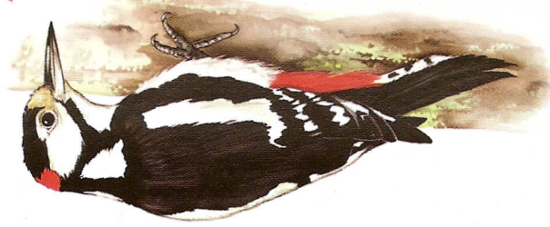
Pic épeiche. Dessin P. R.

Au creux de la vallée de l'Orge, la basilique restaurée de Longpont a vécu de la ferveur des rois et des Chrétiens. On retrouve la légende de la Croix-Rouge-Fer, gravée à l'intérieur de la basilique.